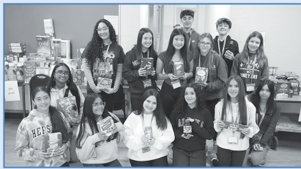
Los estudiantes de Wisdom Lane organizaron una colecta de alimentos para el Día de Acción de Gracias.

Una vez recibida, su solicitud será revisada y, si cumple con los requisitos de la ley de educación, se le emitirá una boleta. Para obtener más información, comuníquese con el secretario del distrito al 516-434-7002.