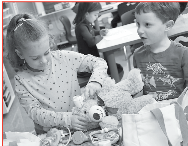
As part of the Career Exploration program, East Broadway students took on the role of a doctor.