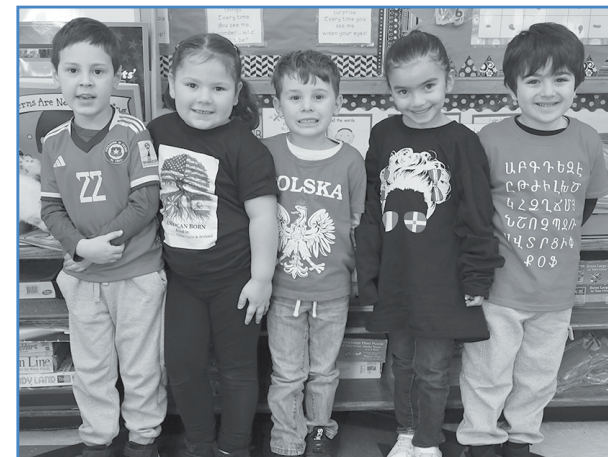
Las diversas culturas de Gardiners Avenue estuvieron representadas en el Día Multicultural.