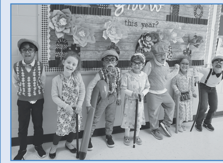
Abbey Lane students became centenarians to mark the 100th day of school.

Upon receipt, your application will be reviewed and if it meets the requirements of the education law, a ballot will then be issued to you. For more information, contact the district clerk at 516-434-7002.